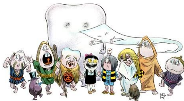
鬼太郎 (ゲゲゲの鬼太郎) きたろう

「鬼太郎」是由「妖怪通」漫畫家水木茂所創作的日本漫畫，他被譽為「戰後妖怪復興的第一人」。戰後日本兒童對妖怪形象的認識，許多都是來自於水木茂的作品。他可說是引領動漫界妖怪浪潮的先鋒。