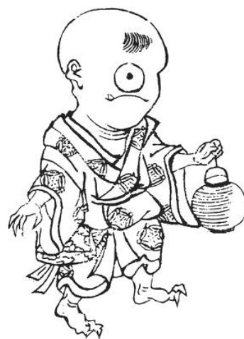
黄表紙における一つ目小僧。(北尾政美)

巡迴各個家庭，並記下過失交由「道祖神」 どうそじん 保管，到2月8日才會取回，並給有過失的家庭降下災難。因此若是在這段期間，燒掉道祖神的神社或神像，獨眼小僧便會以為帳本被燒了，而無法進行懲罰。